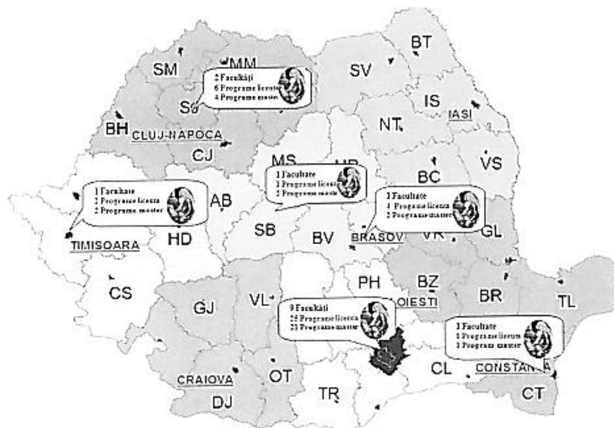
Figura 1. Locațiile în care își desfășoară activitatea programele de studii ale UCDC